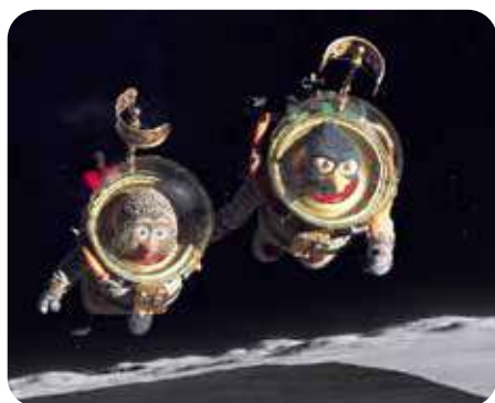
Le Voyage dans la lune de Rasmus A. Sivertsen